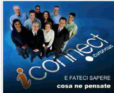
[ banner pubblicitario ]